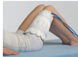
Accesorio plano grande Art. N° 15000009

Existen accesorios anatómicos, que se adaptan a las principales zonas corporales. Estos accesorios son de un solo uso.