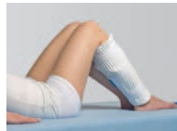
Accesorio de pantorrilla Art. N° 15000015