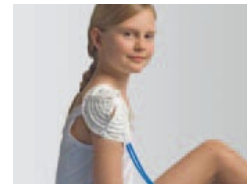
Accesorio redondo pequeño Art. N° 15000007