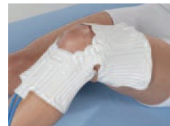
Accesorio de rodilla Art. N° 15000016