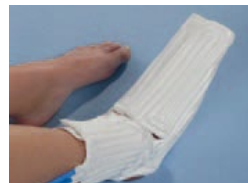
Accesorio de pie Art. N° 15000018